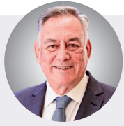
ANTÓNIO TÂNGER CORRÊA EURODEPUTADO

O Tribunal de Contas Europeu revelou que, entre 2014 e 2021, a Comissão Europeia entregou mais de 1,5 mil milhões de euros a ONGs, sem garantir transparência